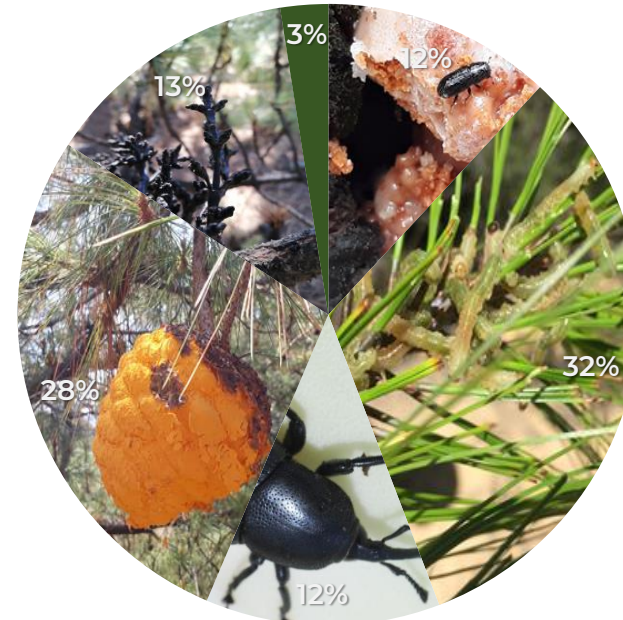
Superficie asignada con PF.1 Tratamientos Fitosanitarios (ha)